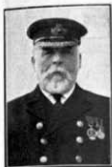
Mr. Smith, Capitán del "Titanic", que se suicidó al hundirse el buque