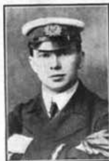
Mr. Jack Phillips, radiotelegrafista del "Titanic", héroe del naufragio

Los años de la navegación marítima no registran una catástrofe tan espantosa como la ocasionada por la pérdida del Titanic . Ocurrido el siniestro durante la noche, por violento choque del buque con un banco de hielo, solo la serenidad y el valor de la tripulación hicieron que no fuera el total de las personas que iban a bordo el número de las víctimas: prueba esa serenidad que hasta el momento de hundirse el buque estuvo funcionando la telegrafía sin hilos del mismo, demandando auxilio a otros vapores que navegaban próximos al Titanic , auxilio que fué prestado lo más oportunamente posible. Han perecido ahogadas 1.635 personas, entre ellas millonarios norteamericanos y hombres de valía y talento, habiéndose salvado 502 pasajeros, la mayoría mujeres y niños, y 203 tripulantes. El Titanic realizaba su primer viaje en esta travesía del Atlántico en que ha naufragado. Las pérdidas materiales que ha ocasionado este desastre cubren á quinientos millones de pesetas.