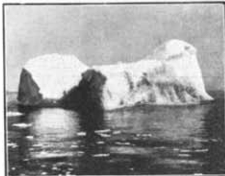
Uno de los bancos de hielo que flotan sobre el Atlántico del Norte