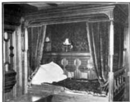
Dormitorio de un camarote de primera clase del buque perdido